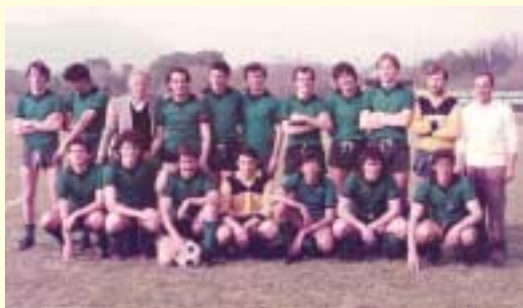
LA FORMAZIONE VINCENTE DEL 1984: PRIMA SQUADRA