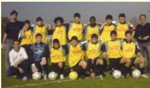
CALCIATORI "IN ERBA": I GIOVANISSIMI '90