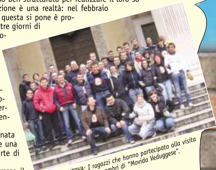
VISITA A MANTOVA: I ragazzi che hanno partecipato alla visita a Mantova, tra i quali i membri di "Movida Veduggese".