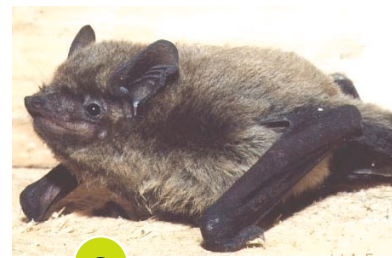
8 Pipistrello ferro di cavallo