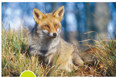
2 Volpe rossa