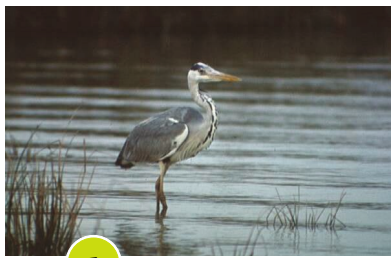
1 Airone cinerino