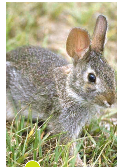
9 Lepre comune