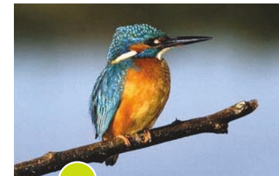
10 Martin pescatore