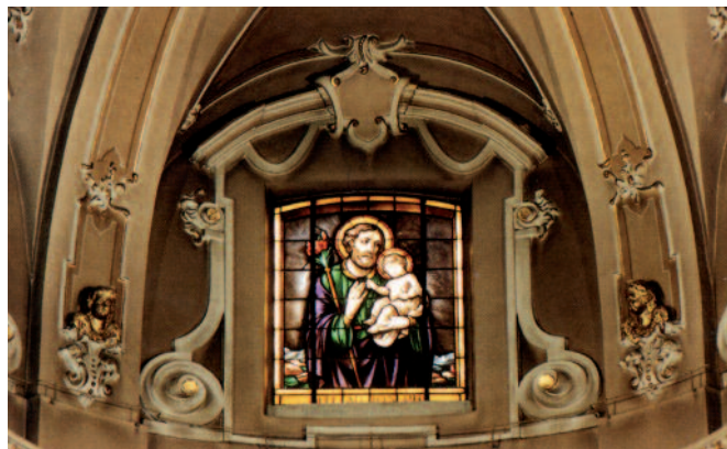
S.Giuseppe col Bambino – Vetrate dell'abside