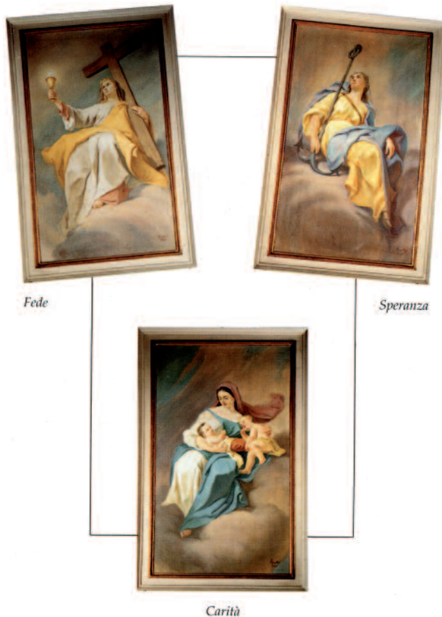
Le virtù teologali – Giordano Cappelletti (olio su tela)

Al 31 dicembre 1941 la somma raccolta era di lire 50.000, frutto di tanti sacrifici e privazioni. Agli inizi del 1942 fu chiamato lo scultore