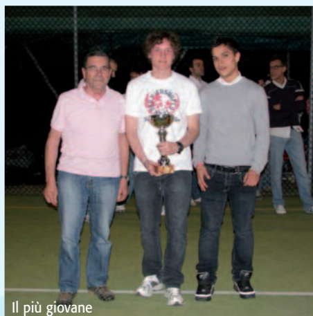
Il più giovane