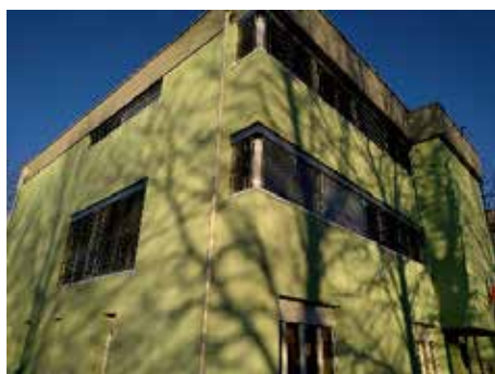
La scuola media rinnovata