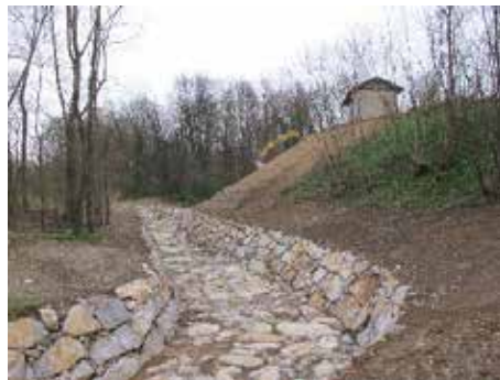
I lavori alla Roggia Peschiera

Questo progetto è ad impatto zero sulle casse comunali: l'intervento si ripagherà con il risparmio energetico e l'importo totale dell'intervento, che supera il milione di euro, sarà coperto con i soldi già previsti a bilancio per la gestione dell'impianto attuale consentendo anche un leggero risparmio economico.