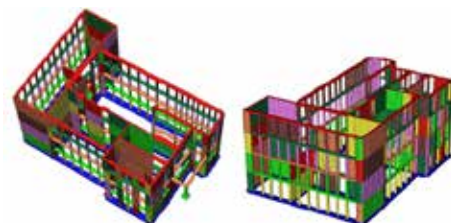
Analisi strutturale dinamiche della vecchia scuola elementare