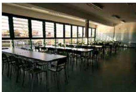
La nuova mensa alle scuole elementari