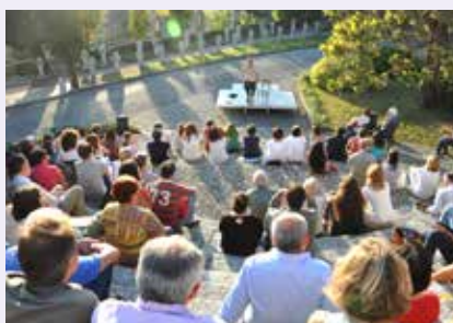
Ultima luna d'estate, 5 settembre 2017