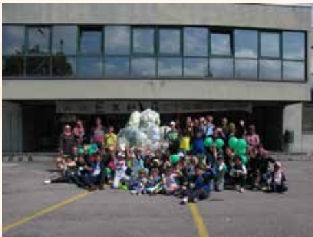
Festambiente: installazione con bottiglie di plastica